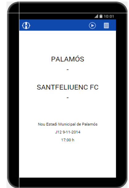
Prototip de l'aplicació